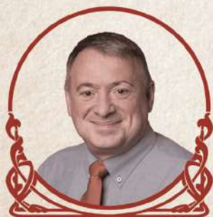
JOAN SANS I FREIXAS Alcalde de l'Arboç